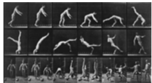
Fotografia sequencial de Eadward J. Muybridge.

Na época da invenção da máquina fotográfica por Eadward J. Muybridge, que ficou conhecido por seus experimentos com o uso de múltiplas câmeras para captar o movimento, além de ter sido o inventor do zoopraxiscópio — dispositivo para projetar os retratos de movimento —, que seria o precursor da película de celulóide usada ainda hoje, era muito grande a distância entre fato científico, percepção visual e representação artística. As implicações estéticas dessas invenções só seriam manifestadas pelos artistas do Movimento Futurista, no início do século XX.