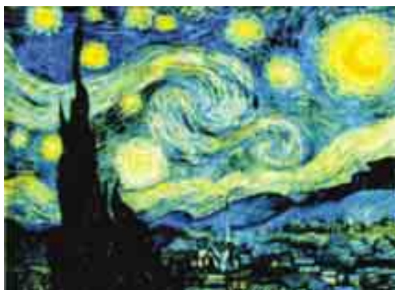
Figura II - Vincent Van Gogh. Internet: <www.3.bp.blogspot.com>.

Na cor física, também denominada óptica física, as principais características de uma fonte luminosa são matiz, brilho e saturação, como ocorre no cinema, ao passo que o processo de formação de cores por pigmentação — cor química, também denominada óptica físico-química — baseia-se na descrição da palheta do pintor, uma vez que a luz, ao atingir a camada de pigmentos, sofre processos de reflexão, absorção e transmissão, como ocorre na pintura e nas artes.