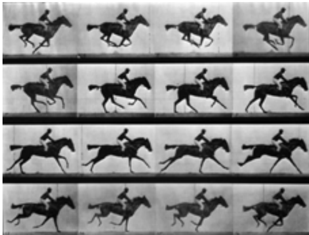
Eadweard Muybridge. Le cheval au galop.