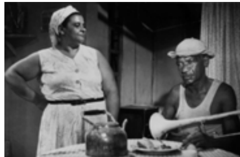
Nelson Pereira dos Santos. Rio 40 Graus . Internet: <www.ufmg.br>.

1 No final da década de 50 do século passado, Rio 40 Graus , de Nelson Pereira dos Santos, e O Grande Momento , de Roberto Santos, indicavam o caminho por onde seguiria o novo 4 cinema brasileiro. “Câmara na mão, trata-se de construir” — eram as palavras de ordem. Mas não só o cineasta construía: críticos cinematográficos, estudantes, empresários e público 7 ajudaram a criar o Cinema Novo dos anos 60. Glauber Rocha, então feroz polemista da imprensa baiana, proclamava: “É da independência cultural que nasce o filme brasileiro”. O Cinema 10 Novo desenvolvia-se em torno de uma estética acentuadamente politicizada, cujos carros-chefes eram o anti-imperialismo, o anticapitalismo, a denúncia do subdesenvolvimento e a defesa da 13 justiça social e do nacionalismo.