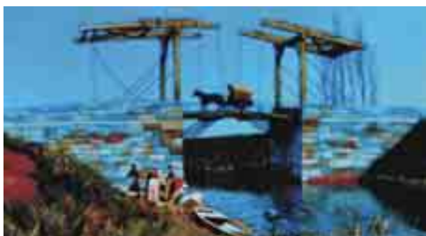
Figura I - Akira Kurosawa. Sonhos . Internet: <www.fotografia-de-cinema.blogspot.com>.